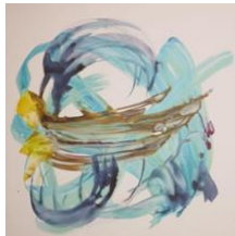
Figure 1- Calligraphy artwork, rec-on and Khamoosh audio residency.