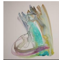
Figure 3- Calligraphy artwork, rec-on and Khamoosh audio residency.